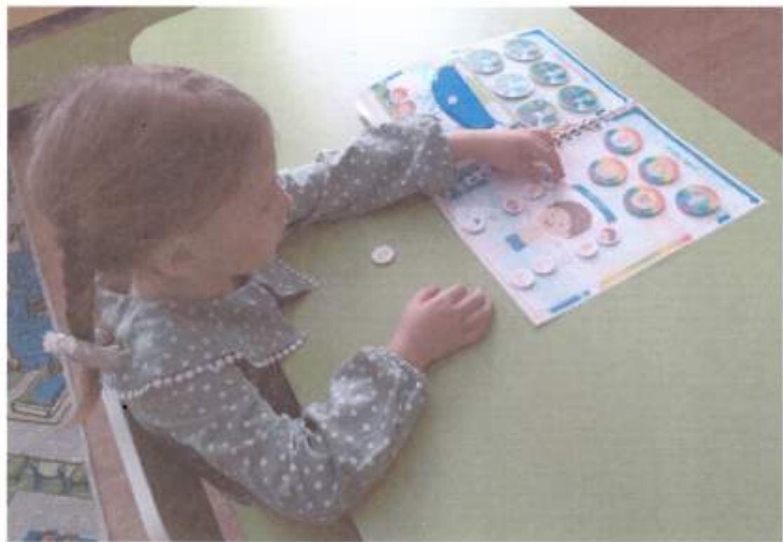
12. Приложение к лэпбуку: раскраски по теме, пословицы и поговорки, дыхательная гимнастика.